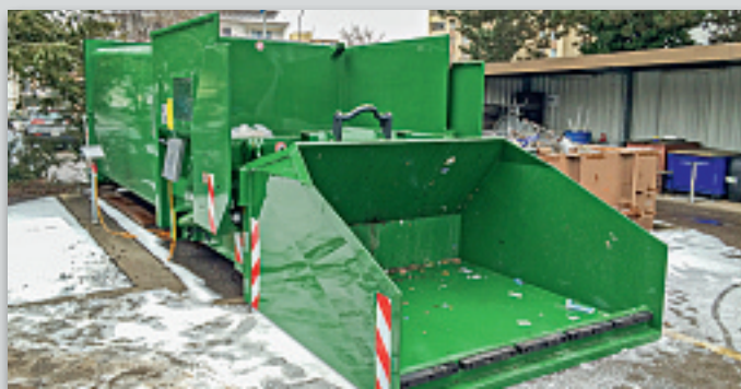
Ladeschaufel – für Städte- und Gemeindewerkhöfe.