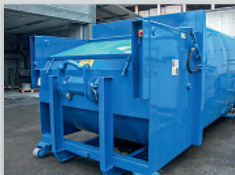
Schwingkolbenpresse – wasserdichte Ausführung für Nassabfälle.