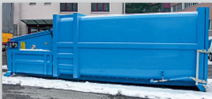
Sperrmüllpresse – verstärkte Ausführung für Sperrmüll.