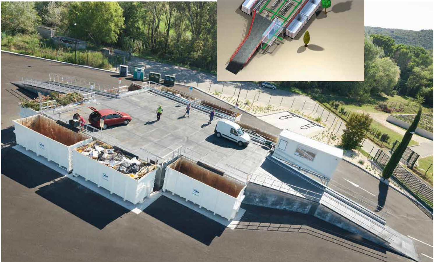
Plateforme de recyclage aux fonctions optimales: tri en haut, stockage en bas.