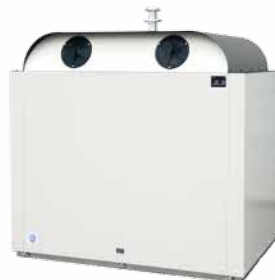
Conteneur de collecte

Grâce à leur design élégant, les conteneurs de matière recyclables et les systèmes enterrés Bauer s'intègrent parfaitement à tout environnement, contribuant ainsi à un tri propre des déchets.