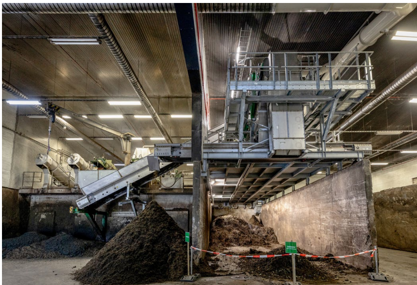
Deux nouvelles tables de criblage à étoiles améliorent nettement la qualité du criblage.

hall de réception et font l'objet d'un contrôle visuel visant à détecter les matières étrangères telles que les sacs en plastique, les pots de fleurs, etc. Puis, elles sont broyées à l'aide d'un broyeur lent à deux arbres. Le broyeur prépare le matériau de manière à le rendre apte au criblage en aval. S'il est vrai que le matériau est ainsi entièrement fragmenté, il le sera cependant de telle façon que les matières étrangères conservent une certaine taille. Cela permet de les séparer plus efficacement par la suite. Afin d'optimiser le fonctionnement de la technique de criblage, le matériau est réparti uniformément sur toute la largeur de la table de criblage à l'aide d'une trémie et d'un bunker de dosage. La conception de l'installation de criblage est particulière : au lieu d'une longue table, deux unités de criblage plus courtes ont été installées, avec une zone de chute intermédiaire. Lors de la chute vers le second niveau, les amas se désagrègent, ce qui améliore la qualité du criblage.