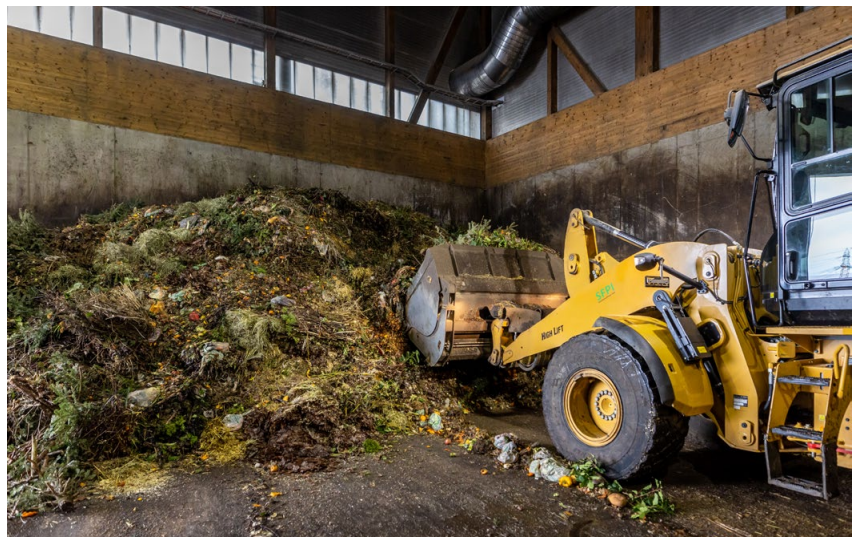
Déchets verts frais avant la digestion dans le fermenteur.

L'objectif principal de l'installation SFPI est un approvisionnement énergétique durable. Le biogaz produit est directement transformé en électricité et en