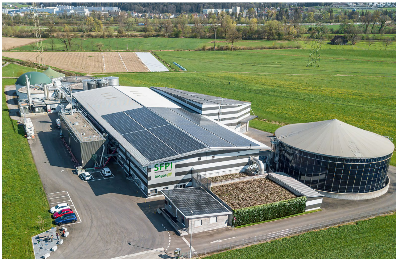
SwissFarmerPower in Inwil: combinaison de la fermentation sèche et humide.

Les matières solides telles que les déchets verts sont déchargées dans le