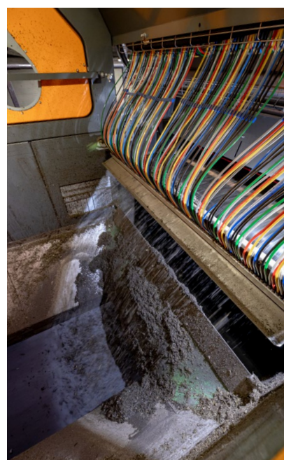
Buses et capteurs séparent avec précision les corps étrangers du digestat.

cours de laquelle il est aéré. Il en résulte un engrais de recyclage de haute qualité et du compost, après un traitement supplémentaire. En raison des contraintes d'espace sur le site d'Inwil, la filière de finition fine a été conçue de manière particulièrement compacte, sans compromis sur l'accessibilité et la maintenance. Pour réduire la part de corps étrangers, le digestat est soumis, avant la phase de maturation, à un traitement de finition supplémentaire : nouveau criblage, cette fois-ci en deux fractions. Tout matériau inférieur à 10 mm s'utilise directement comme engrais. Le matériau compris entre 10 et 40 mm est analysé à l'aide d'un système proche infrarouge. La caméra détecte avec une grande précision les plastiques clairs et le verre. Un système optique complémentaire à laser et détecteur de métaux identi-